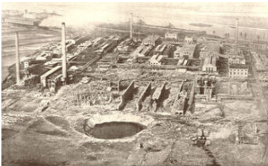
Zur Nacht der Explosion mit der Bestung der Zerstörung im Oppauer Werk der Badischen Anilin- und Sulfatfabrik (B. A. S. F.). Die Überreste des Werks bei Sprengung des Ammoniumnitrat-Lagers. Länge des Kraters 125 m, Breite 90 m, Tiefe 20 m, über dem Krater die alte Fabrik.

21.09.1921: um 7.23 Uhr flog das Oppauer Werk der BASF in die Luft. 565 Menschen starben, 2000 wurden zum Teil schwer verletzt. Der Großteil des Nordwerkes wurde zerstört. Im Ammoniumnitrat-Lager (Dünger) wurde wegen Zusammenbackens routinemäßig „locker gesprengt“. Es entstand ein 125 m langer, 90m breiter und 20m tiefer Krater. Von 1000 Wohnungen in Oppau wurden 800 zerstört. In Worms (60 km) gingen noch die Fenstern kaputt, 80 km weiter in Frankfurt war der Knall noch zu hören.