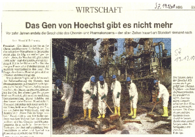
Süddeutsche Zeitung 19.12.2008

22.02.1993: Um 4:15 Uhr entweichen am Rosenmontag in Frankfurt 10,5 Tonnen eines Ortho-Nitroanisol-Gemisches aus dem Werk Griesheim der Hoechst AG über Dach ins Freie und kontaminierten etwa 30 ha der Stadtteile Frankfurt-Griesheim, Schwanheim und Goldstein mit einem klebrigen gelben Gemisch. In Folge dazu waren bei Hoechst bis 1995 insgesamt 18 Ereignisse (davon 3 Störfälle) zu beklagen.